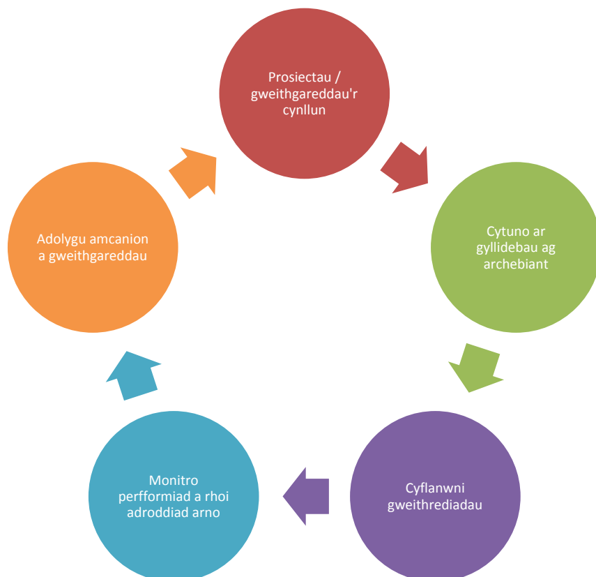
Ffig 3: Cylch Cynllunio / Cyllideb / Cyflawni / Monitro / Adolygu: